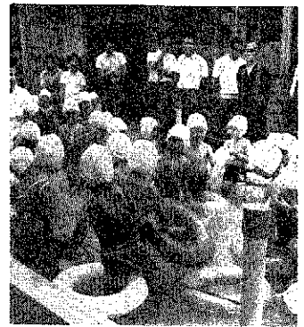
越前浜保にプール 父母の会が贈る