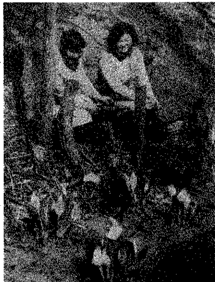
(水ばしょうの清そな美しさに引かれ見物人も多い)