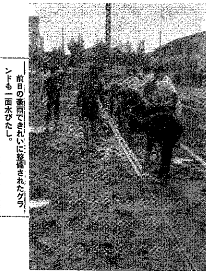
前日の豪雨で水びたしに整備されたグラウンドも一面水びたし。