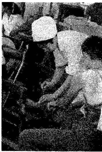
熱戦にケガ人が続出救護班も大活躍。