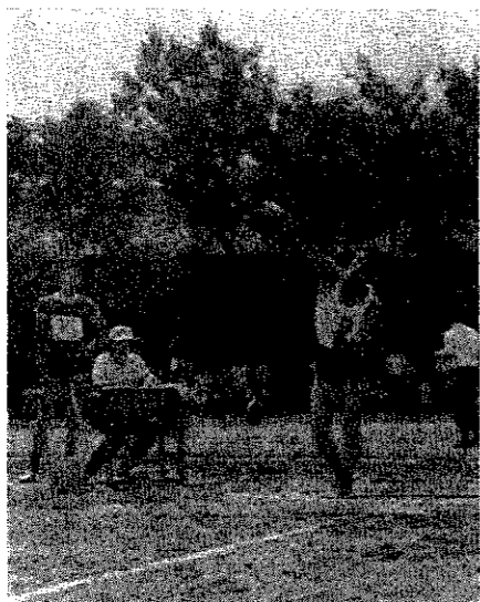
盛り上がった筋肉がピンと伸びると重い砲丸が空に飛びランドにめり込む。