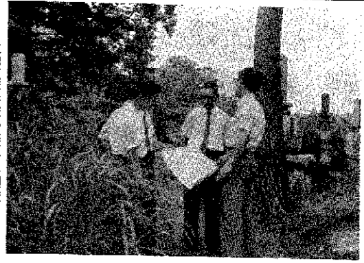
現場で修復工事の検討する関係者