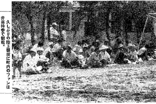
久しぶりの陸上競技に町内のファンは弁当持参で観戦。