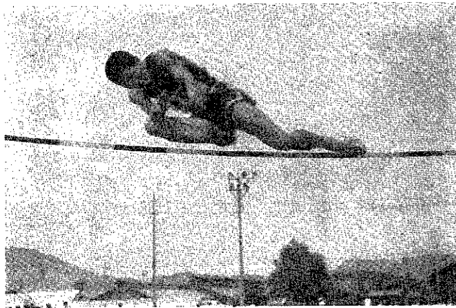
定高跳、美しいフォームでバーを越える選手。

8月23日、24日の2日間におたって第17回新潟県青年大会が全国大会の予選を兼ね、西蒲原郡内の各町村で開催された。 当町では、大会の花壇上競技と工芸展が開かれたが、大会前日の無情な豪雨でせっかく丹念に整備した中学校グラウンドも一面水びたしとなり、一時は陸上競技の開幕もあやぶまれる悪コンディション。しかし、中、高校生、競技役員などの必死のグラウンド整備が功を奏して一時雨止れで競技を開始することができました。 「より速く、より高く、より遠く」各地の予選を勝ち抜いて来た選手で各種目県ナンバーワンを競いました。この写真特集は青年大会陸上競技の表情をとらえてみました。