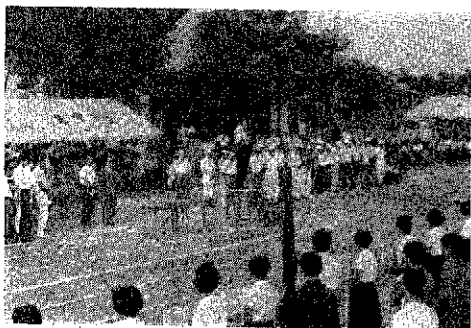
全ての競技を終了、選手にねぎらいの言葉を贈る江崎町長。