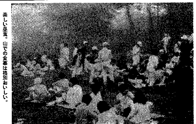
にぎわう角田山 遠足シーズン。角田山(標高481m)は、連日かわいなお客様でにぎわっている。あえぎながら登ってきた小学生も頂上に立ち、秋色濃い越後平野、佐渡ヶ島を一望「ワーイー」と歓声を上げる。町も町民いこいの場にと、角田山開発に本腰を入れている。

巻町立病院診療科目のお知らせ 巻町立国民健康保険病院は、次の通り診療を行っております。