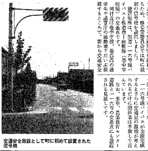
交通安全施設として町に初めて設置された信号機

気軽にどうぞ 相談の部落巡回 心配ごと 役場の中に住居相談が開設され、町民のみなさんから相談が寄せられています。相談内容は、国民の生活に直接関係する問題について、行政機関に意見を述べ、行政の改善を促すことを行います。