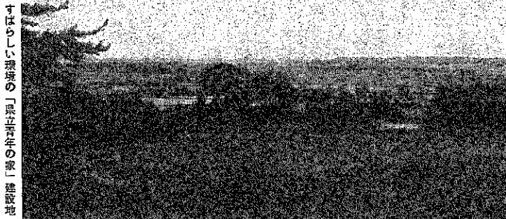
すばらしい環境の「県立青年の家」建設地

「県立中央青年の家」は、県内の青少年が溶けこみ、集団で自主的に職業、生活文化、体育レクリエーションなど、学習活動をする場所です。青少年の相互交流、楽しいこの場としても利用されます。