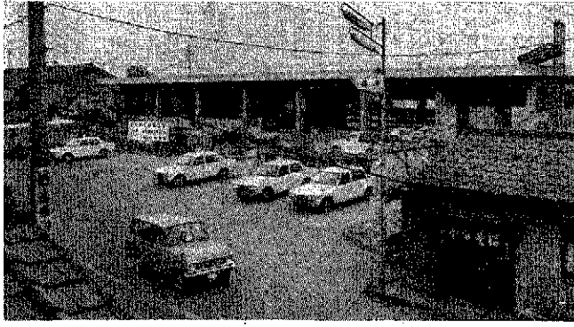
スマートな駅に衣替えも近況。工事も順調だ。

町民待望の表玄関新巻駅舎の改築工事が十一月二十日過ぎ完成(予定)めざし急ピッチです。去る六月、取りこまれた前の駅舎は明治四十五年八月に建設されたもので、越後線沿線中もっとも古いものでした。近年高校の新設、サラリーマンの増加で乗降客が非常にふえ、ラッシュ時には待ち合いに室に収容しきれずあふれ始末。また、建設後五十五年も経て、老朽化しているため、町が主体となり関係団体と一九にわたって数年共同築造局に駅舎改築準備してきたものが実ったわけです。新駅舎の建て物は鉄筋コンクリート平屋建て。色はクリーム色。長さ四十四メートル、幅八・三メートル、総面積四百五十五平方メートルで現在の岩室駅の約二倍の広さ。駅舎内には、事務室、待ち合い室、男女便所などが設けられます。なお、待ち合い室は百四十四平方メートルで従来の二倍になり、ゆとりたつたものになりました。駅舎側のホームに四十八メートル、向側ホームに四十八メートル、跨線橋取り付部分六メートルの旅客上屋がつき、雨天でも雨がさなで汽車を待つことができます。また、乗降客の安全をはかるため、跨線橋に渡る際、橋