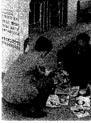
悪書を読みこんだ白ポストをあける係員

青少年に有害な悪書の没収をはかるため、巻町管内に四月設置された白ポストが善悪警察、町公民館員の手で初めてあけられました。この白ポストは、巻ライオンズクラブから町青少年問題協議会に一ツ「見せない」の返行のため、没収利用されたかと、今回あけられたものです。白ポストには全部で二十六冊は