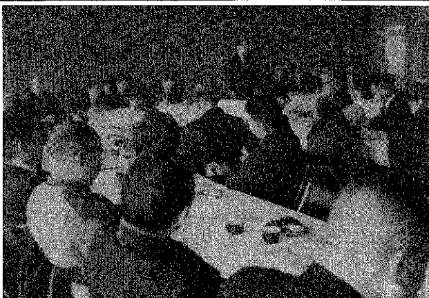
町づくりに活発な意見交換が行なわれた区・部落長会議