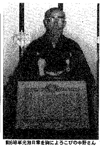
町6峰岸光旭日章を胸によるごびの中野さん