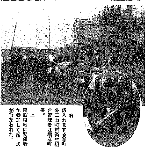
建設用地に関係者が参加して起工式が行なわれた。

巻町外三力町村衛生組合はかねて懸案であったごみ焼却場建設、このごみ焼却場は、巻町外三力町の四方村に建設され、一日三十トンのごみを処理できます。建設費は巻町、湯沢村の共同負担で、二万八千八百八十八坪の用地を買収し、焼却炉はモハラB型焼却炉一基、復元二連、六次式で焼却をよくなるため耐火に