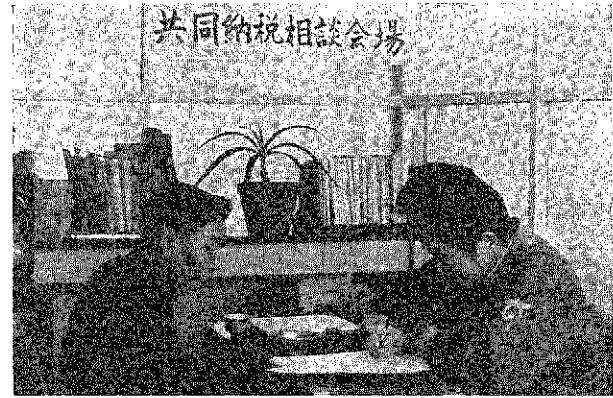
共同納税相談会場

1967年2月25日 第23号 発行 新潟県巻町役場 電話 代表 23131 編集 企画 調査 課 住民登録人口 (昭和42年1月31日現在) 総人口 27,780人 男 13,353人 女 14,427人 世帯数 5,908