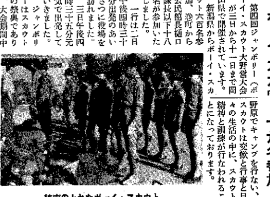
統率のとれたボーイ・スカウト