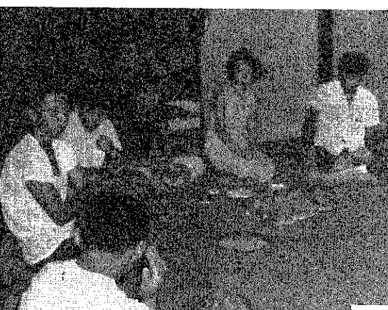
分宿先でなごやかに交換会