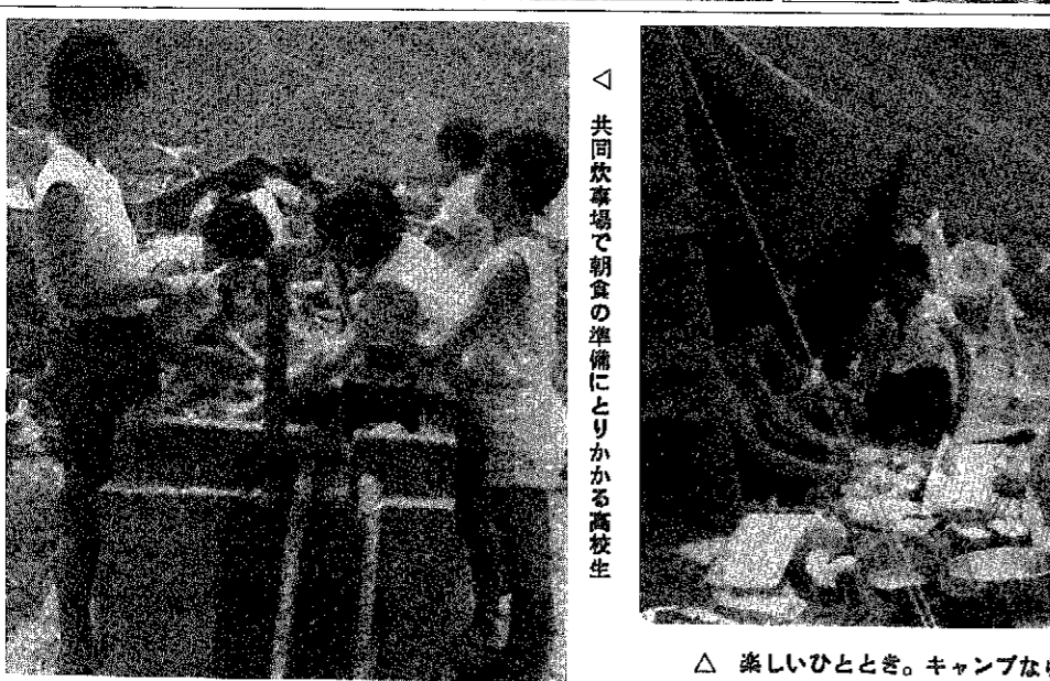
△ 楽しいひととき。キャンプならではの味わえない料理に舌づつみ