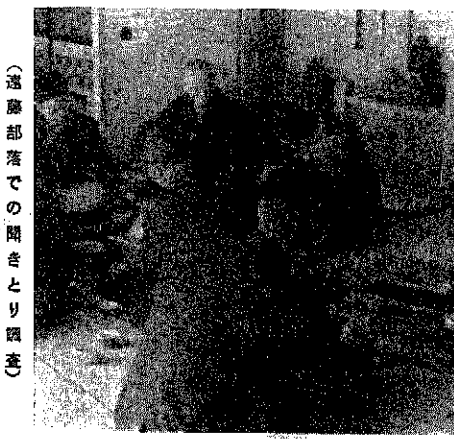
(遠藤部落での聞きとり調査)

○三沢先生その他 三沢 医師と患者の関係ですが、ヨーロッパでは、患者が、自分病気の時は、このお医者さんにと、登録制があったり、チェッコのように、地域担当が各医師に決められている所もあります。