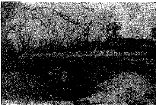
東伏上と羽田を結ぶ朝陽橋が12月15日に完成した。長さ17米、有効巾員3米の永久橋で巻町簡井組が請負。この橋の完成で西川沿いの巻町北西部の交通は一歩と強化され地域の発展が期待される。

新しく成人になられる皆さんに心からお祝いを申し上げます。昭和41年度の巻町成人式が、1月15日巻小学校に於て行われます。今年の成人式に招待される該当者は昭和40年4月2日から昭和41年4月1日までの出生者です。