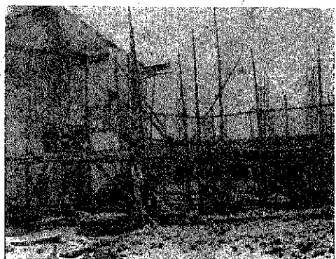
(写真) 増築中の病院

(一般病棟増設) 巻病院の病床利用率は、昭和三十六年の八九・五%をさかんに年々向上の途をたどり昭和三十九年度では一〇七%となっている。そのため入院を要する患者でもベッドの空くのを待たねばならぬ状態が続き、住民に大変迷惑をかけてきている。加えて最近入院される人々の動向が個室を望むようになり病床が不足している。 幸い巻町では昨年度の国民年金保険料の納入が九〇%を超えたため年金融資が許可され、併せて国保施設整備補助金を受けることができ、現在一般病棟増設工事が進行されており、明春までに特別室を含む三〇〇床の病室が完成する予定である。 尚新病棟増設を機会に人間ドックを実施すべく、現在その内容を検討している。 施設の内容 鉄筋コンクリート二階建 坪数 約一〇〇坪 病床数 一階二〇床、二階一〇床 特別室 二 設備 電話、テレビ、冷蔵庫、冷房装置、ロッカー、ガス装置、手洗、集合兼用ソファ、一等室 六 設備 テレビ、ロッカー、手洗、小型除菌機、バス、トイレ (巻病院)