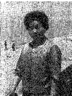
今回県教委主催の国内研修旅行に参加した。一行は二班編成で、私は福井、石川班に編入された。引率の主任先生を加えて五名、私を除いた班の平均年齢は四十才という働きざかりの方たちばかりで、全くむだのない研修旅行で私には少し強行軍の感がした。