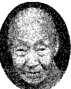
敬う「よい習慣が一致してきている」巻町の年中行事である敬

社会が安定し、個人の生活がよくなってきたと、誰れしも永生きをしたいと願ってくる。 しかも、老人福祉法の制定と、日本古来の「年寄りを敬う」よい習慣が一致してきている。 巻町の年中行事である敬