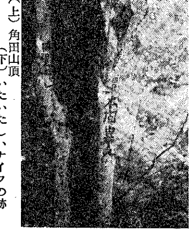
(上) 角田山頂 (下) いたいたしいナイフの跡

この立木と処かまわすきざみこまれたナイフの跡か、下げられたこの札と対象的である。この第三日曜日に巻岳友会がこの頂上で山の祭典をするとか。道路、道標、山小屋の整備など残された町の問題だらうが、ともかく美しいものを美しいなりにみんものものとして育て、ゆきたいと思う。