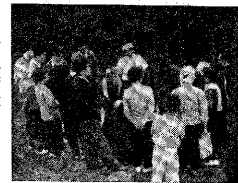
対象として開設されるが、農漁業に關係ある課目については十一月以降部落でも開設の予定で、第一回は九月二十九日

漁業 漁業が魚類の船に積みこまれた土に不足と底引は「こぬか」がねり網の侵入によつて、限度に船によつて造られた