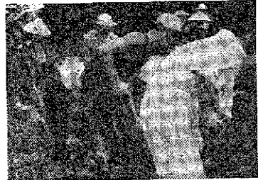
国民科学講座 文部省委員の国民科学講座 受講者四十余名、熱心が、巻町で開設されることになりました。