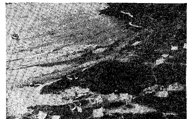
(写真は小浜のキャンプ場)

これを裏書きするか如く、その月の二十七日に国立佐渡彌彦国定公園としてひろく世に紹介され、観光地浦浜として脚光を浴びるにいたつた。観光地浦浜は巻よりバスで五十分、三方を彌彦、角田の山麓に囲まれ、一方は、遠く佐渡を望む日本海に面した一四八世帯、五八二人の一見いかにも平和そうなる部落である。しかし実情は半農、半漁、出稼ぎによつてその生計のささえとしてゐる小規模な村落である。秋の終りから春にかけては交通全く杜絶え、陸の孤島と言われ、加えるにその中心産業であつた漁業の凋落から他に活路を求め、部落を離れてゆく人も多く、一時は部落そのものが、やがて消