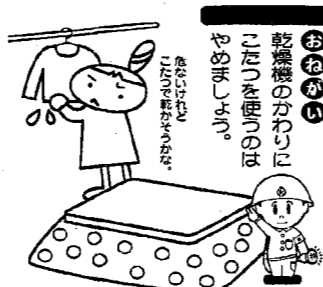
東北電気保安協会