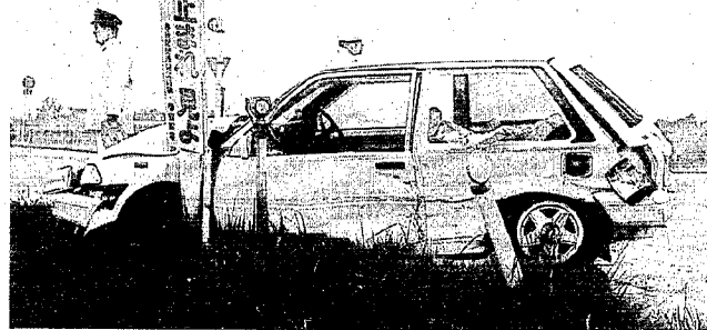
29日午前9時半ごろ、濁東村卯八郎受の信号のない農道交差点で、新津市高橋さんの乗用車と、黒崎町山岸さんの乗用車が出会い頭に衝突。高橋さんの車の後部座席に乗っていた母親のヤヨエさん(46)が首の骨を折って即死した。 — 4月30日 新潟日報朝刊 —