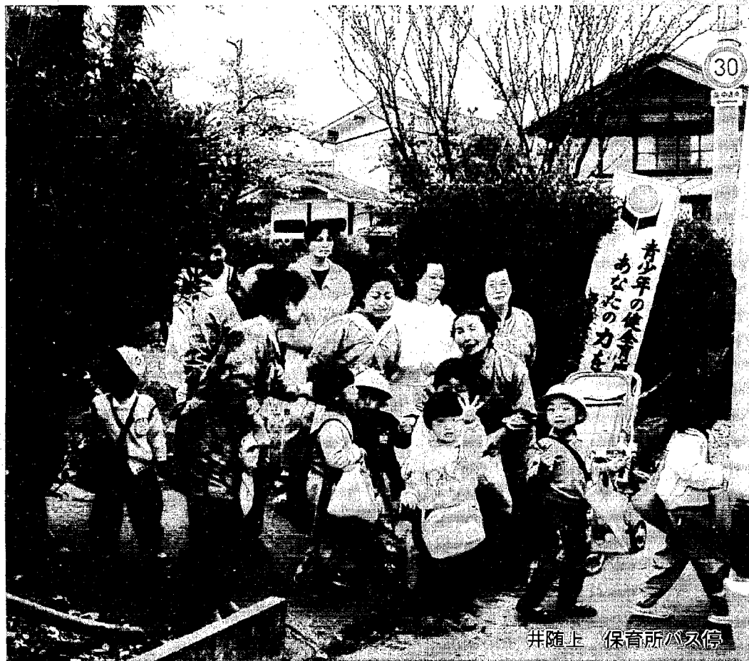
井随上 保育所バス停