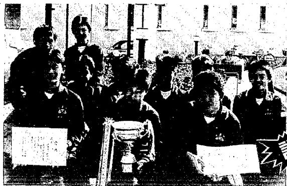
レース経過 1周3.2km周回コース

優勝 潟東中 1時間8分21秒 2位 岩室中 1時間8分21秒 3位 内野中 1時間8分57秒