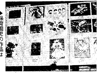
保育園児の作品は とってもユニーク