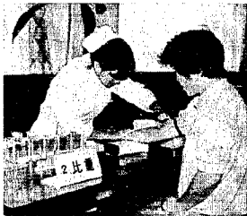
受付後、比重の検査