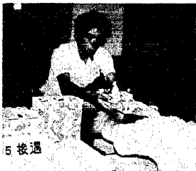
「ありがとう」と粗品です

出血がありショック状態に陥った時や熱傷、肝臓病、腎臓病などの治療に使用されます。 ・免疫グロブリン製剤 体内に病原体が入った時に病原体を攻撃する「抗体」と呼ばれる成分を製剤化したものです。先天的又は後天的に免疫グロブリンが低下した場合や、重症の感染症などの治療に使用されます。