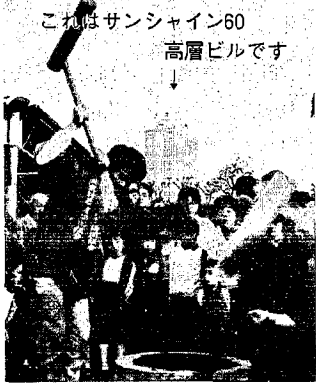
これはサンシャイン60 高層ビルです

このイベント前から、東京都潟 東村人会を設立したいとの動きが あったそうです。今回のような事 業を計画するにも都合が良いし、 都会の方にはふるさとの提供や交 流の場として活用できると思いま す。まだ計画段階ですが、一日も 早くできると思います。