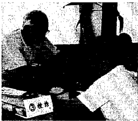
血圧を計り献血車へ