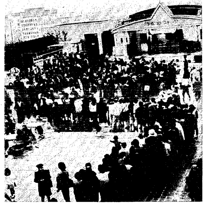
「コシヒカリ」を求める人で行列ができました

米消費拡大イベント「コシヒカリ・フェスティバル」 ーN東京が、二三日東京池袋東武デパートで開かれまし た。当日は天候にも恵まれ「潟東村産のコシヒカリ」を 大勢の都民に配ることができました。 米消費拡大の今回のイベント効果がどのように出てく のか興味津津です。