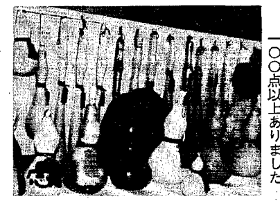
「あなたも作ってみませんか」ひょうたん全部で 一〇〇点以上ありました