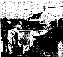
航空防除も実施 稲作の豊作

そして、このことは今年から実施された空航防除の関係者をホッとさせる結果となりました。