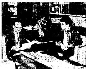
役場へ成績のご報告

大会三日目に行われた高跳びは、三十二人が出場し、一八三センチを跳んで予選を通過したのは、そのうち