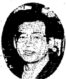
①生年月日 日 27・11 ②血 型 B型