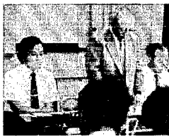
9月11日の水田利用再編対策推進会議の様相、他用途利用米をめぐる農協関係者の様子中央会も返答に苦しい

しかし、ほとんど米の出荷作業が終わった十一月末現在でも完全出荷されておらず「転作百%達成確定」とはまだいえない状況であり、「まだ未出荷の人は、ぜひとも出荷くださるよう、お願いいたします」とのことでした。