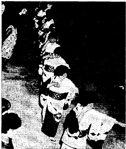
とても素人に見えません