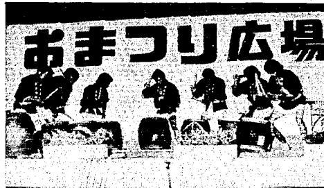
ついに出来た潟東太鼓