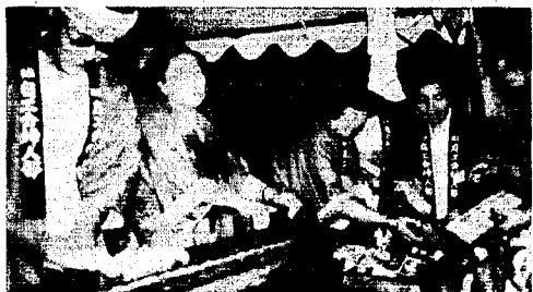
焼鳥・ジュース いらんかね!