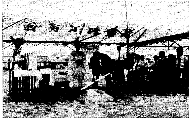
工事の安全と早期完成を祈ってくわ入れをする村長 (建設現場起工式)

農村環境改善センターの起工式は、八月十八日午前十時三十分から建設現場である役場裏、交通公園予定地において行なわれました。工事の入札は、八月十日に行なわれ十四日には臨時会が開会されました。 この施設は、鉄筋コンクリート造一部二階建、総延面積千九百平方メートル、総工事費一億九千九百九十五万円が見込まれています。 建築工事は、一億四千万円で、佐藤建設株式会社に、電気工事千六百万円で株式会社東水電気に、設備工事三千五百四十五万円で、新潟日立冷熱株式会社それぞれ請負いました。