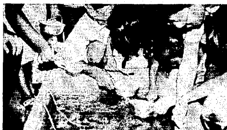
子供たちの人気を集めた金魚すくい