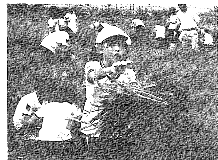
▲「草がいっぱいあるよ〜!」

《農業委員も農業の「かけ橋」として総合学習に参加》 和納小学校5年生が台風18号の去った先月8日、6月21日に植えた古代米の草取りをしました。「でっけ〜草だ!」根が深くは抜けて「一本で植えた苗が50本以上に増えている!」古代米ってどんな味するんだろ?と口々にしながら、無農薬での田んぼの草をせっせと刈り取っていました。 また、隣の畑から3年生と6年生が植えた枝豆をもらい、美味しそうな枝豆をうれしそうに抜いていました。中には、根につらついている根瘤菌(こんじゅうきん)を発見して「これってなあに?」と農業委員に質問をする場面も見られ、児童は大喜びでした。