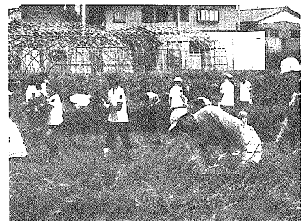
▲農業委員も小学生といっしょに草刈り

農業委員会は、農地法や農業経営者支援促進法等の法令に定められた事務を行う行政委員会としての役割と、農政活動を展開する農業団体としての機能を併せ持った組織です。 農業委員会は、農業者の代表機関として、農業の発展、農業者の地位の向上を図るといふ観点から行つたものです。また、農業者や農業団体のみならず、それ以外の者に対しても、農業及び農業者に関する正確な知識、情報を普及することが求められています。(農業委員会法より抜粋)