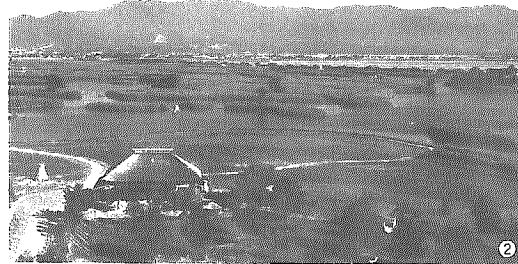
①ユニークな外観で、ひときわ目立つ水の駅「ビュー福島湖」 ②春夏秋冬、自然を感じることができる福島湖 ③希少な水生植物であるオニバス ④冬になると福島湖を訪れるオオヒシクイ

合併旅日記シリーズも迎えて5市町村目。今回、村左エ門が訪れたのは岩室村から最も遠い市町村である豊栄市。湖と鳥や花が一体となって、四季折々の素晴らしい自然が残されている。豊栄市のシンボルともいえる福島湖に立ち寄り、また、福島湖と人との関わりの歴史などを紹介する水の駅「ビュー福島湖」も見学してみます。