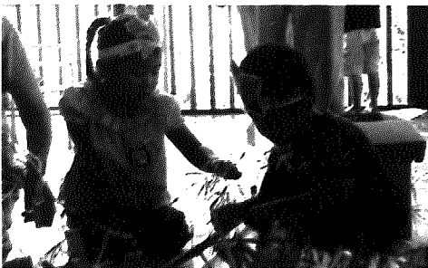
▲「ねー、どんなお願いしたの?」