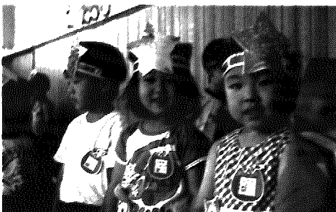
▲子どもたちは、思い思いの星をデザイン