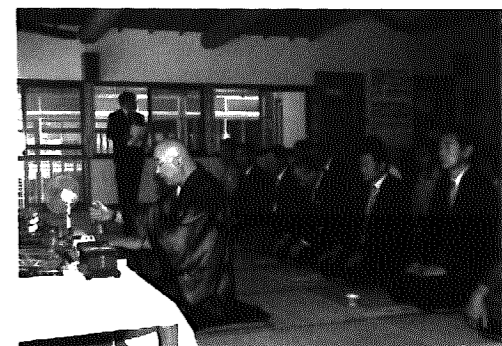
◀海水浴の安全を祈願する参列者たち

出演したのは、村の文化協会に加盟している民謡会や踊りの会などの10団体。当日は蒸し暑く、演技をするには厳しい気候でしたが、約300人の熱心な観客が見守る中、発表会がスタート。岩室太鼓に始まり、合唱、カラオケやケーナの演奏から民謡踊り、フォークダンスなど出演者たちは、この日のために練習してきた成果を十分に発揮していました。また、最後には出演者のほか観客も交えて岩室甚句を踊り、会場は一体感に包み込まれながら幕を閉じました。