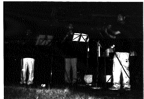
◀神秘的な音色が公園内に響きわたる

テント張りや料理など、初めて挑戦する子や慣れた手つきの子など、さまざまでしたが、子ども会のお父さんやお母さんの指導のもと、一生懸命取り組んでいました。また、レクリエーションゲームなどを通して新しい友だちができ、楽しい思い出をたくさん作った子どもたち。研修が終わる頃には、ひとまわり大きく成長した姿がありました。