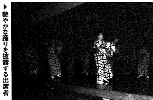
▶艶やかな踊りを披露する出席者

前日からの雨で、外での開催が心配される中、6月26日に丸小山公園において、恒例の「蛭と野外コンサート」が約700人の観客を集めて開かれました。今回演奏したのは、新潟メモリアルオーケストラの皆さん。「おぼろ月夜」といった懐かしい曲から「川の流れるように」、「地上の星」といった名曲など12曲を披露。観客は、静寂の中に流れる幻想的な音色にうっとりしていました。また、村内ボランティアグループの協力のもと、岩室温泉病院とかたくりの里の入所者たちも多数訪れ、普段は聴くことができない神秘的な音楽に大満足の様子でした。