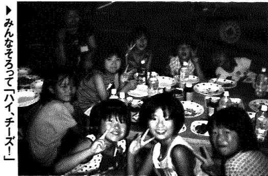
▶みんなそろって「ハイ、チーズ!」

まずは、みんなで力をあわせて笹飾りの取付作業。さまざまな願い事が書かれた短冊や色とりどりの笹飾りで大きな竹が彩られ、会場内は七夕気分になりました。また、おしゃべり会の皆さんが、あやとりやお手玉など昔懐かしい遊びを披露。華麗な手さばきに子どもたちは感心し、新たな興味を持っていました。続いて行われた岩室村ハーモニカクラブの演奏会では、優しい音色で親しみのあるメロディが奏でられ、聞く人は癒しの世界へ引き込まれました。そして、最後に全員でお昼ご飯を食べ、楽しい七夕会は幕を閉じました。