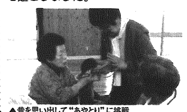
▲昔を思い出して「あやとり」に挑戦

先月15日、周瀬やすら木で、平 成15年度の寿学級閉講式が行われ、 「あやとり」や「お手玉」など、な つかしい「昔」の遊びで楽しい時間 を過ごしました。