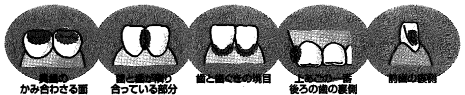
①:20 ②:10 ③:5の2と4

歯垢のたまりやすいところは、汚れやすくみがきにくいところ。ピンクの部分は虫歯や歯周病になりやすいところ。