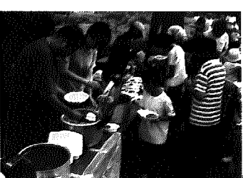
▲カレーのいい匂いがプンプン

先月24日、大字岩室地内の「しものつつみ」において、岩室温泉旅館組合と青年部の主催による、カレーライス・ザリガニ釣り大会が開催され、約150人の元気なちびっ子たちと父兄の皆さんが参加しました。当日は夏の日差しが照りつける中、午前11時にザリガニ釣りの競技が開始されると、ちびっ子たちはさっそく糸をたらし、人よりも大きなザリガニを釣ろうと、真剣な顔で水面とにらめっこ。しかし、なかなか成果は上がりず、そのうち、子どもよりも一生懸命に釣ろうとする父親や母親の姿も見られました。競技終了後は、待ちに待った特製カレーライスが登場。温泉旅館の厨房でたっぷり煮込まれたアツアツのカレーを、野外でみんなと一緒に食べました。釣り上げられたザリガニはほんの数匹でしたが、参加した皆さんは、親子そろって夏の日の楽しいひとときを過ごしていました。