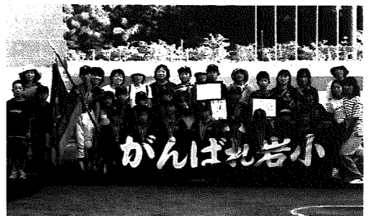
▲優勝旗を手にしたルーキーズラインとお母さんたち

先月9、10日の両日、三条市民球場において県央地域11市町村の代表チームによる選抜少年野球大会が開催されました。岩室村代表の岩室ルーキーズは、初戦の夏戸ペアーズ(寺泊町代表)戦に7-5とやや苦戦したものの、準決勝の弥彦ザ・ジェイ(弥彦村代表)戦は19-0で3回コールド勝ち。決勝は選手一人一人と監督、コーチの紹介の後、前年度優勝チーム分水少年野球団ペアーズ(分水町代表)と対戦。強打を誇る岩室ルーキーズは11-0と相手を圧倒して優勝を成し遂げ、優勝旗と優勝カップを手に入れました。なお、この大会で岩室村のチームが優勝するのは7年ぶり2回目となります。