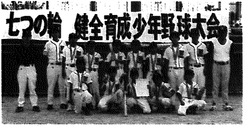
▲健闘した和小ピクトリーズ

7月19日、岩室村を会場に巻警察署管内7町村の少年野球チームによる第5回七つの輪健全育成少年野球大会が開催され、決勝で岩室ルーキーズが6-1で和小ピクトリーズを破り優勝しました。これまで、この大会で村内チームが決勝に進出したことがなく、初めての優勝・準優勝となりました。