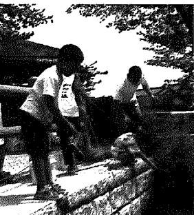
▲なかなか釣れないな～