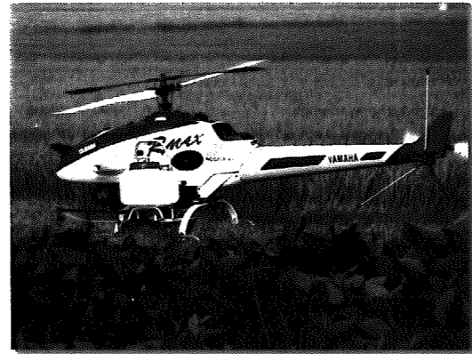
▲繊細な動きで地上防除に威力を発揮!! ラジコンヘリコプター

農業は「農業取締法」に基づき、登録の際に毒性、発ガン性、土などへの残留及び魚等への影響等、あらゆる角度から厳重に審査されたうえで製造・販売されています。したがって農業ごとの「使用安全基準」を守り、適切に使用すれば人の健康や生活環境を害することはありません。航空防除では、法的に審査され登録された農業を使用し、安全性に十分留意して実施しています。