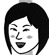
こんにちは 保健師です