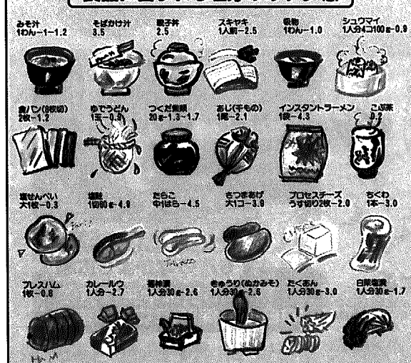
②:03 ①:20 ①:10 ②:50のり