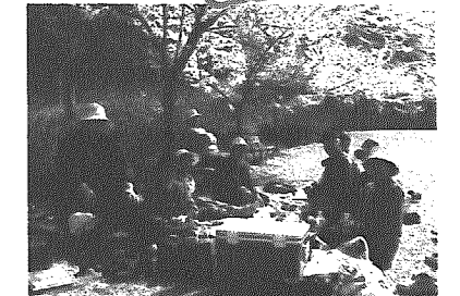
▲丸小山公園、花見の風景