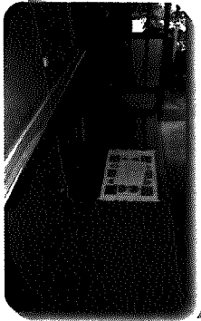
▲改修されて、新しくなった玄関付近

いつまで2人で生活していけるのだろうか、不安になることもありますが、住み慣れた間瀬で、みんなに世話になりながら、頑張っていきたいと思っています。