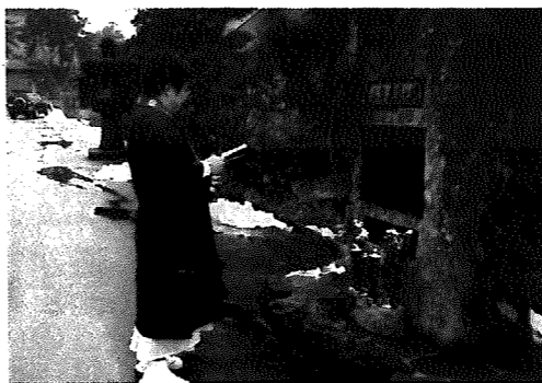
▶顕彰碑の前での読経