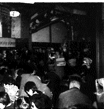
▶「いっしょに拾うぞ!」