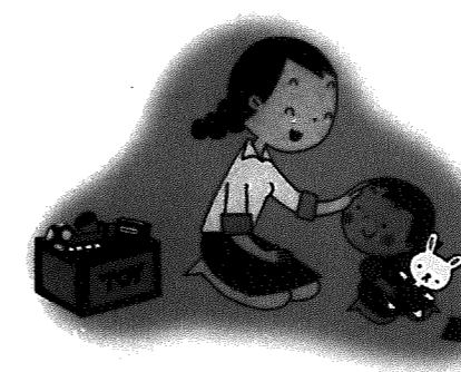
◎:30 ◎:20 ◎:10 飛鳥のとろろ

岩室村では歩けるようになる1歳位から各保育園で行われる「なかよし広場」を開放しています。 しかし、また歩けない子どもの中に乳児を連れて行くのは心配という声も聞かれます。 そこで出産について不安がある妊婦さんと、乳児を持つ母(出産の先輩)と子が集まる場(マタニティサークル)を保健センターを会場に設けています。 出産について、育児について、離乳食について何でもかまいません。みんなで集まり気兼ねなく話をしたり、子供の成長を一緒に喜びませんか?