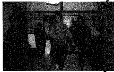
▲和納8区「8日会」のダンス

「今日は楽しかった。また次も来るね」と集まって来られるお年寄り、「どんなみそ汁を作ろうか」「楽しいレクリエーション何かないかな」と会を支えるボランティアさんが「ひとつの輪」となって、活気づいているのがよくわかります。お年寄りの健康作り、生きがい作りの一環として、昨年度の7か所から、今年度10か所へと、徐々に広まってきたこの「地域のお茶の間」。「自分たちの所でもやってみたい、立ち上げのお手伝いをして欲しい」という地域は、ぜひご相談ください。ここで暮らしてよかったと思えるような地域を、みんなで作っていきましょう。