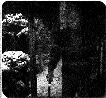
▲自宅の廊下で歩行訓練

…新聞は必ず読みますし、テレビのニュースも見るように心がけています。また、亡き妻への供養と自身の健康も兼ねて朝夕のお経は欠かしません。また、家の中が周り廊下のように、ぐるっと周れるようになって