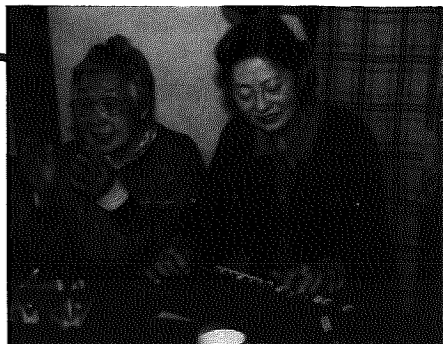
▲同瀬「いくまか家」テーマソングの合唱