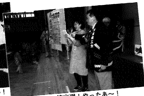
▲一等当選! やったあ〜!