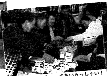
▲美味しいよっ。さあいらっしやい!