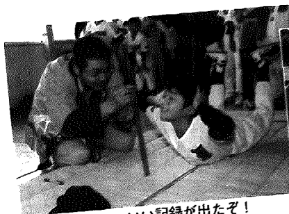
▲おおっ、いい記録が出たぞ!