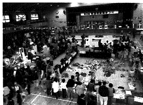
▲お賑わいの会場内

10月27日、第2回岩室村産業まつりが村民体育館で、村民ら約1,500人が訪れる中、盛大に開催されました。当日は悪天候の中、朝から大勢の人が訪れ、各イベントは大賑わい。ゲームコーナーや体力測定コーナーでは子どもたちの笑い声が会場に響いていました。また、出展者の格安な商品や、新鮮な野菜などを目当てに訪れたお父さんお母さんたちは、両手いっぱいのお買い物袋をさげ、会場を後にしていました。まつりの終盤には芸妓衆による華麗な舞が会場を盛り上げ、続いて行なわれた夢の大抽選会には、最高3万円の旅行券をはじめとする多数の景品が用意され、当選番号が発表されることに会場からは大きな歓声が上がっていました。