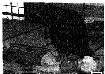
▲一刻を争え!命を救う心肺蘇生法

この講習は、心肺蘇生法等傷病者を救命するために行われる応急手当を応急手当指導員が指導し、講習を修了した者に対し修了証が交付されるもので消防団をはじめ、一般からの希望者が受講されました。受講された皆さんは慣れない動作にとまどいながらも熱心に取り組み、応急手当の大切さをあらためて確認しました。