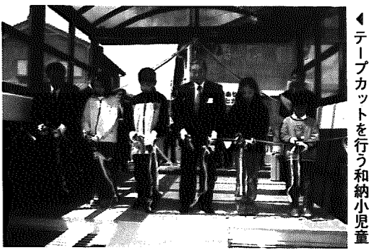
▲テープカットを行う和納小児童

先月8日、岩室中学校で入学式が行われ、男子43名、女子47名の合わせて90名の新生が3年間の学校生活のスタートを切りました。入学者認定の後、校長先生のお話からお祝いの言葉、歓迎の言葉と続く中で、真新しい学生服に身を包んだ新生は、小学校とは違った、少し大人になった雰囲気にも包まれ、これからの新しい学生生活に胸を膨らませていました。