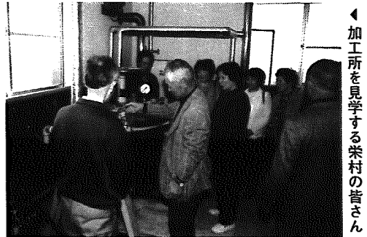
▲加工所を見学する栄村の皆さん

ごみの有料化を目前に控えた3月24日、全村を対象とした岩室村クリーン作戦が実施されました。参加者はそれぞれ自分たちの地区の集合場所に集まり、ごみ袋一杯の空き缶やビニールごみなどを回収していました。村のボランティア団体や企業ボランティアの参加もあり回収されたごみは全部で、な・な・なんと約4トン!! 皆様のご協力ありがとうございました。