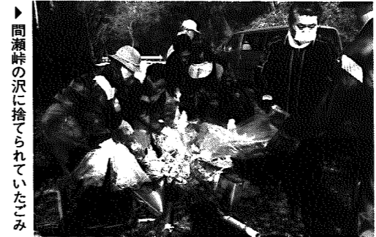
▶間瀬峠の沢に捨てられていたごみ

①加茂警察署②分水町(自宅は新潟市)③奥さん、息子さん、娘さん④海釣り(4級小型船舶免許あり)、写真⑤野球やサッカー観戦(高校野球、アルビレックスなど)⑥周りの町村に比べると事件、事故が少なく静かでおだやかな所だという印象です。⑦何が起こるか分からない今の時代だからこそ、駐在所という地域安全センターとしての役割を十分に果たすため、住民の力をお借りしながら、がんばっていきたい。