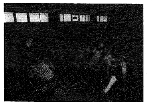
▲ “良い子になります” と豆を投げる園児たち

先月1日、村内各保育園で、節分のまめまきが行われました。例年、商工会青年部の協力を得て、こわい鬼たちが各保育園に登場していますが、ここ和納保育園でも、園児の心の中にある「泣き虫鬼」や「好き嫌い鬼」などを取り去ろうと、赤鬼と緑鬼がノッシノッシとやって来ました。鬼を見るなり逃げ回っていた園児たちも、心の鬼を持っていてもらおうと勇気をだして「鬼はーそと！福はーうち！」と撃退。最後は、福の神からお菓子をもらい、大喜びの園児たちでした。