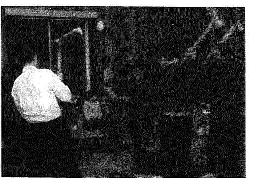
▲ 5人が杵を持ってベッタンベッタン

悪天候となった先月19日、すこやかセンターやすら木で、間瀬保育園主催のもちつき大会が開かれ、中央保育園の年長組32名も参加しました。いつもは、園児の保護者に間瀬地区の方々に加わり行われていたもちつきですが、今年は、4月から小学校で一緒になるお友だちが加わり『やすら木』もにぎやか。間瀬地区独特の、5人が豪快に杵を振るうスタイルに中央保育園児もビックリ。アツという間にできあがったアツアツのおもちを、両園児とも仲良くほおぼっていました。