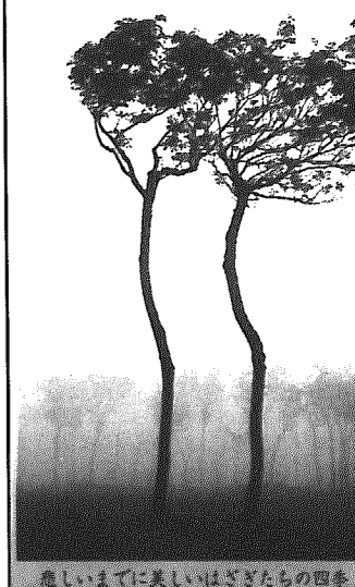
思い出に美しいはざぎたちの四季