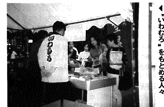
「いわむろ」をもとめる人々

首都圏に夏の新潟の魅力を知ってもらおうと、先月8日から11日にかけて、東京は青山にある表参道・新潟館ネスパスで『日本海・夏景色への招待』と題して観光PRイベントが行われました。このイベントは、弥彦地区観光連盟主催で開催され、岩室村も参加。当日は米菓や地酒、ハザ木の写真などで岩室を紹介。また、10・11日には、クイズ大会や芸妓さんによる岩室甚句の踊りの実演も行われ、魅力満載の岩室をさまざまな角度からアピールしてきました。