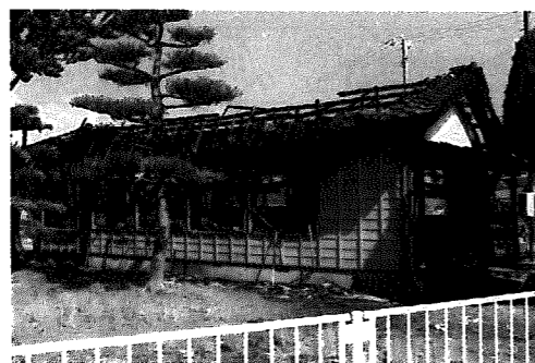
▲北野公会堂の火災現場

の代表チームが日頃の訓練成果を披露しました。その結果、第5分団(周瀬)チームが優勝し、今日2日に巻町で開催される郡大会への出場権を獲得しました。 その後、会場を岩室温泉街に移して分列行進を行い、「富士屋」の駐車場付近にて消防団員、消防署員が二斉に放水訓練を行いました。 参加された皆さん、本当にご苦労さまでした。これからも、村の安全のためにがんばってください。