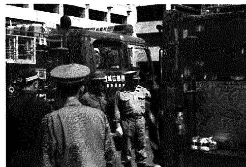
▲機械器具点検の様子

最近、各地で火災が発生しています。村内でも先月、建物火災が発生してしまいました(II写真下II)。瞬時に私たちの生命や財産を奪ってしまう恐ろしい火災から私たちの生活を守るため、先月18日に「岩室村消防定期総合演習」が役場駐車場をメイン会場として行われました。 当日は開会式が行われた後、消防団員と消防署員の通常点検(人員姿勢・服装の点検)や機械器具の点検(それにポンプ操法競技会など)が行われました。ポンプ操法競技会では、村内各分団