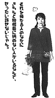
滞納しない、正しい納税。

消費税及び地方消費税の期限納付 納税は社会の基本的な義務です。日ごろから納税の資金手当や納付の期限に十分注意し、期限内に申告・納付されるよう願います。特に、消費税及び地方消費税は、消費者が負担している税ですから、確実に納税されるようお願いします。