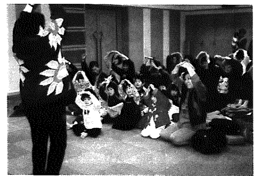
▲みんな楽しそうに…

冷たい風が吹くあいにくの天候となった先月11日、村立図書館で『孫と楽しむ紙芝居』が開催され、おばあちゃんとお孫さんを中心に約50名が参加しました。紙芝居を演じるのは「新潟ひょうしぎの会」のメンバー。面白いお話しからちょっと恐いお話しまで盛りだくさんの1時間。メンバー独特の雰囲気の中、アツという間に時間が過ぎ、参加者から「もっと聞きた〜い」の声があちこちで聞かれていました。