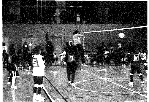
▲男性の力強いアタック

【優勝：「タフマン」 3位：「クレヨン」 準優勝：「ユンケル」 3位：「カトリア」】