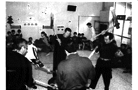
▲5人のいきもピッタリ

先月9日、間瀬保育園では、恒例のもちつき大会が開かれ、保護者や漁師さんら30名ほどがかけつけました。間瀬のもちつきは5人で杵を振る地区独特のもの。園児のもちつき歌におくられた5人は、ベッタンベッタンと息もピッタリ。4升ずつで2回。8升のおもちがアツという間につき上がりました。早速、きな粉もちや油揚げもちなどにされると園児は大喜び。おばあちゃんらとお口いっぱいほおばっていました。