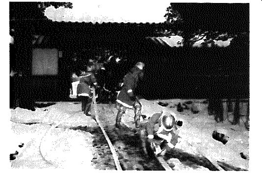
▲本番さながらの訓練

『文化財防火デー』の1月26日、国指定重要文化財、種月寺(石瀬)で防火訓練が行われ、西部広域消防署員、地元消防団、檀家の方々ら50名ほどが参加しました。この訓練は、「長い間守られ続けてきた歴史的遺産を火災から守ろう」と毎年行われるもので、当日は「強風の中庫裡から出火、1名負傷」という想定のもと、本番さながらの訓練が展開され、参加した団員は「後世に残したい村の宝。いつまでも守っていききたい」と決意を新たにしていました。