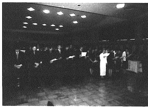
◀ 昨年の成人式から

20歳になられた皆さん、おめで とつございませう。 岩室村では20歳の門出を祝つ て来月15日（日）、公民館講堂にお いて成人式を行います。20歳の 記念に、ぜひご出席ください。