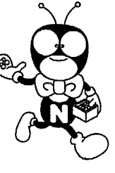
▲新潟県国民年金マスコット ゆめありくん

※社会保険庁年金ホームページに関するお問い合わせは、社会保険業務センター中央年金相談室 ☎03-3333-4131 までお願いします。