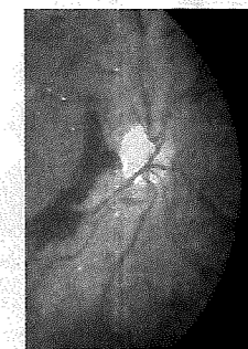
糖尿病網膜症に冒された眼の血管

糖尿病と診断されたら、①網膜症がなくても年に一回、②初期の網膜症があれば三〜六カ月に一回の定期的眼科受診が必要となります。 ■悪化させないために 糖尿病網膜症の治療の基本は血糖コントロールです。それでも進行してしまつた場合は、レーザー光線による網膜凝固術や硝子体手術が必要となります。近年、その器械や技術はめざましく改善してきましたが、不幸にして社会生活を送るうえで十分な視力が得られない場合もまだあります。そのようにならないためにも、早期に、内科、眼科の主治医の指示に従い、生活習慣の改善と定期的受診を心がけましょう。