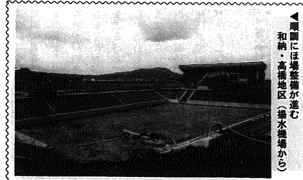
順調にほ場整備が進む和納・高橋地区(揚水機場から)

※過去の実績を考慮し米価を設定しました。尚、加工用米の出荷もしくは取り組む作物によって、補償金は変わります。このように、新たな米政策は、転作完全実施者にとって有利なものとなっています。皆さん、今後の農業経営を考え、一丸となって生産調整にとりくみましょう。