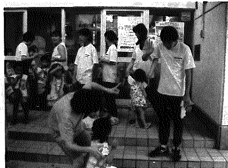
◀「バイバイ」も仕事のうち