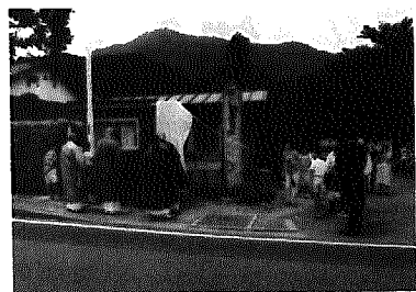
国重要文化財 指定記念碑除幕 種月寺（石瀬）