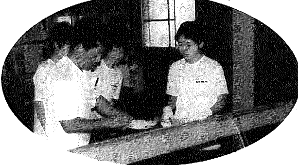
▼漁師さんの手ほどきを受けて