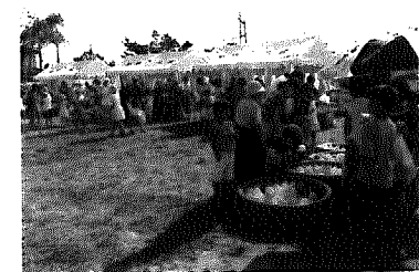
第13回お祭広場 —和納12区で手づくり祭り—