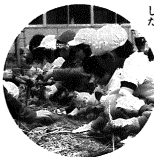
▶岩小さつまいも植えつけより

通行車両の安全性を確保するため、及び工事現場の安全状態確認のため、工事の完了する七月二十日までの間、夜の七時から、翌朝七時三十分まで通行止めとします。ご協力をお願いします。