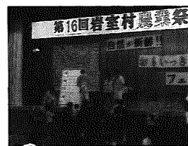
盛りあがったお楽しみ抽選会

農業祭当日に行われたジャンボなわとび大会も今回で五回目を迎え、十三チームが参加し、チャンピオンの座を競い合い、最後まで息のあった金池チームが見事初優勝に輝きました。 優勝：金池チーム 準優勝：石瀬チーム 三位：和納六区チーム 敢闘賞：新谷チーム